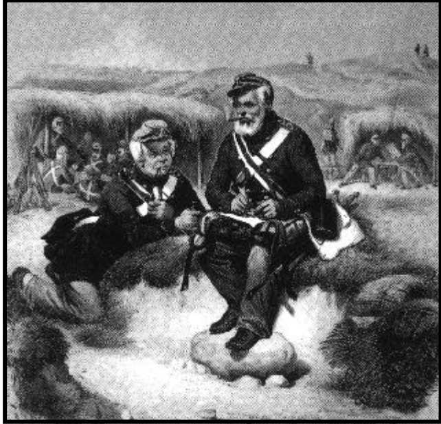
Niels Simonsen: "Brev til hjemmet"